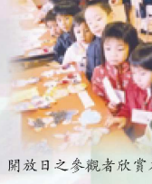
開放日之參觀者欣賞本