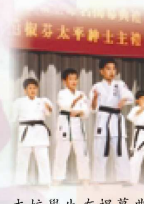
本校學生在揭幕典