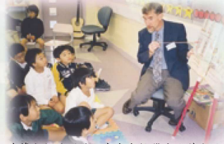
外籍老師於開放日中向本校學生說英文故事。