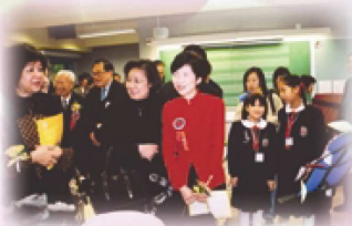
羅范椒芬太平紳士及嘉賓參觀本校的特別室。