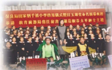
本校合唱團表演，歌聲甜美悅耳。