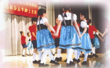
本校舞蹈組組員表演活潑多姿的瑞士兒童舞。