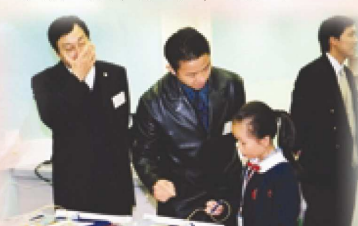
圖書館服務生向來賓介紹英文發聲電子 圖書的操作。