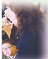
本校通識課之作品。