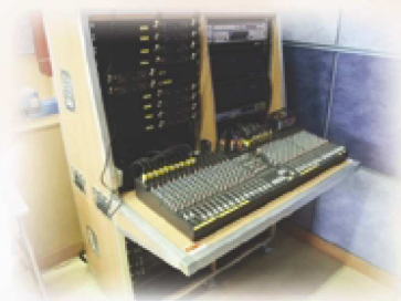
禮堂內的燈光及音響設施。