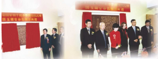
太平紳士主持田玉湖堂 。