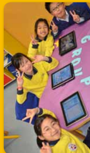
iPad App Learning Lesson