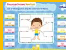
Interactive Learning App