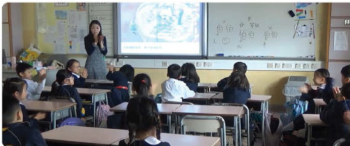
在課堂上我們有互動遊戲

This year, we are a Seed School of the Education Bureau's (EDB) Seed Projects . Under the sub-project Enhancing Self-regulated Learning of Students: Planning of Reading and Usage of Reading Strategies in Primary Chinese Language , a picture book curriculum for Primary 1 students, has been developed to arouse their interest in reading and foster their moral development. Every month, their teachers read them a picture book from a well-chosen selection by the Education Bureau's support team and our teachers. Each book comes with a school-based student booklet for note-taking and sketching. With Cantonese being the medium of instruction and no assessment given, students can enjoy reading with their parents and teachers.