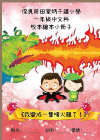
精心設計的校本繪本小冊子

This year, we are a Seed School of the Education Bureau's (EDB) Seed Projects . Under the sub-project Enhancing Self-regulated Learning of Students: Planning of Reading and Usage of Reading Strategies in Primary Chinese Language , a picture book curriculum for Primary 1 students, has been developed to arouse their interest in reading and foster their moral development. Every month, their teachers read them a picture book from a well-chosen selection by the Education Bureau's support team and our teachers. Each book comes with a school-based student booklet for note-taking and sketching. With Cantonese being the medium of instruction and no assessment given, students can enjoy reading with their parents and teachers.