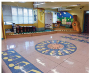
遠程教室 Music Room