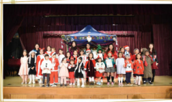
一年一度的聖誕聯歡晚宴