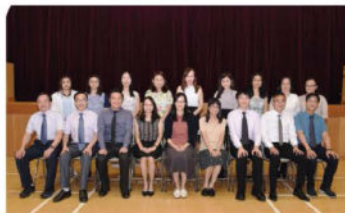
非班主任及副班主任