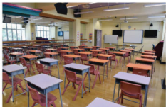
Distance Education Room