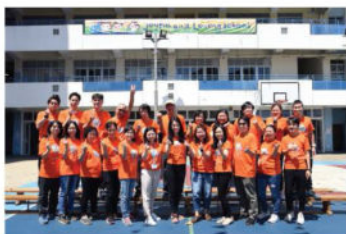
教學助理及校務處員工