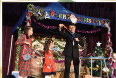
精彩的親子才藝表演