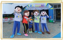
協助聯校親子同樂日