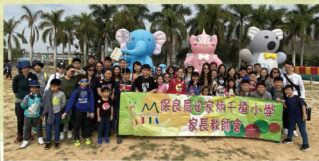
親子旅行齊來大合照